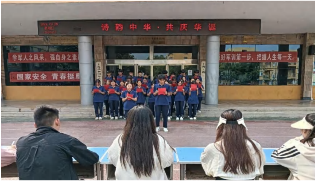
图 1-10 2024.10 诗韵中华·共庆华诞诵读比赛