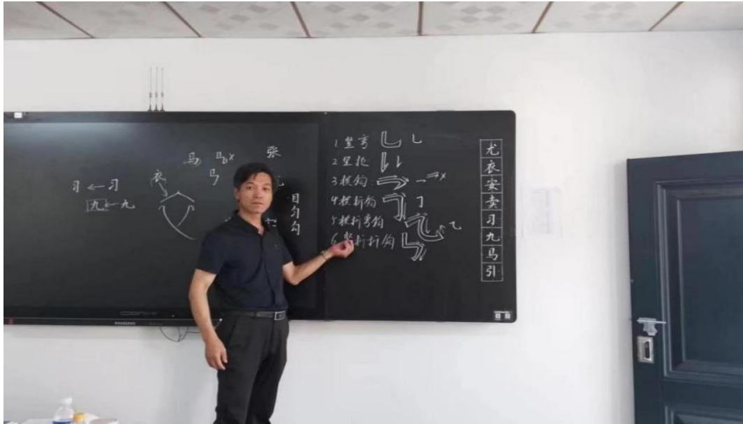
图 6-10 全宏国老师书法进课堂