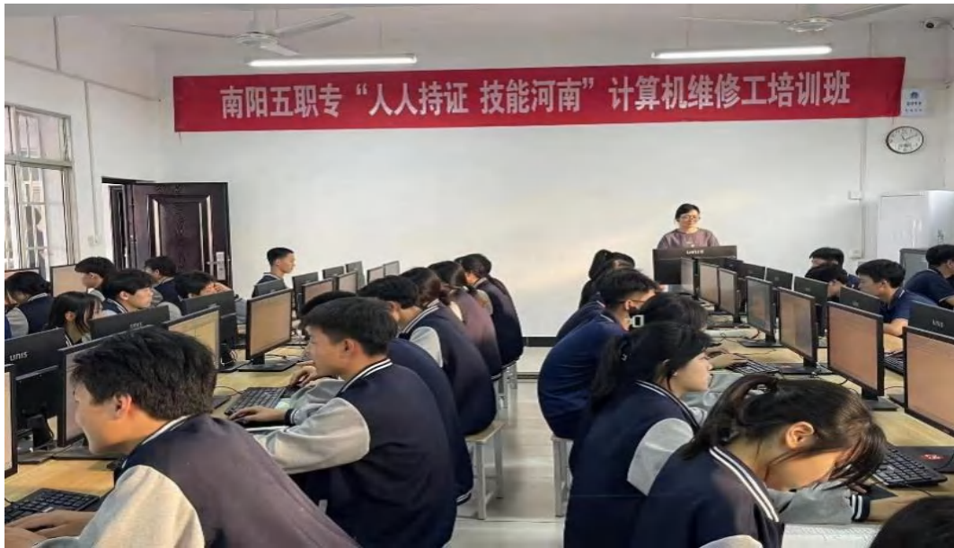
图 7-5 计算机维修工培训班