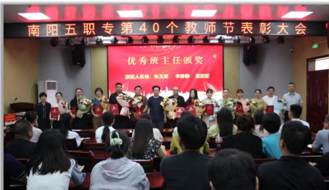
图 1-6 2024.9 优秀班主任、优秀教师表彰

师德师风是教师队伍建设核心。学校高度重视师德师风建设，通过开展师德师风专题培训、师德标兵评选、师德师风承诺书签订等活动，引导教师树立正确教育观、价值观和职业道德观。组织教师观看师德师风警示教育片，通过反面案例，让教师深刻认识到违反师德师风严重后果，增强教师自律意识。