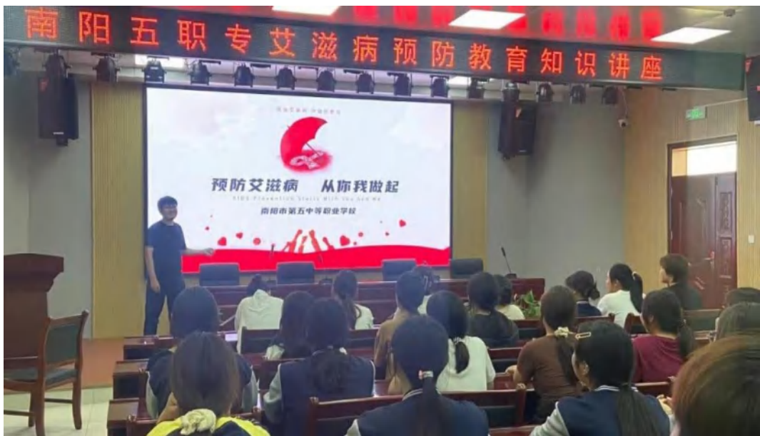
图 2-7 艾滋病防治宣传日主题讲座