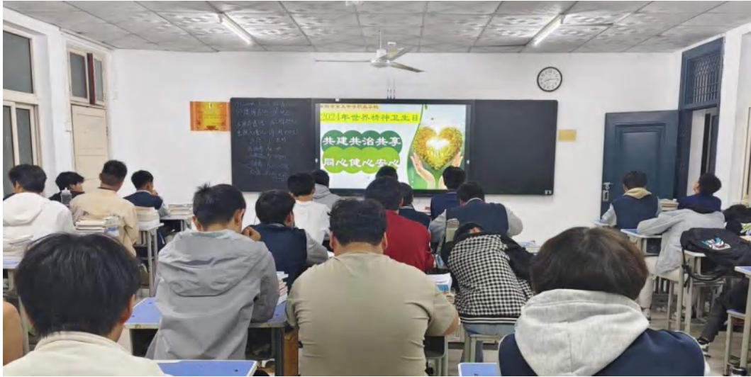
图 2-17 精神卫生日主题班会