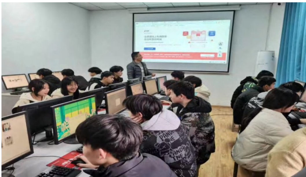
图 1-15 2024.11 信息化教育教学

矩，确保学校内部政治生态风清气正。在文化环境方面，学校注重加强校园文化建设，营造积极向上校园文化氛围，增强师生凝聚力、向心力。