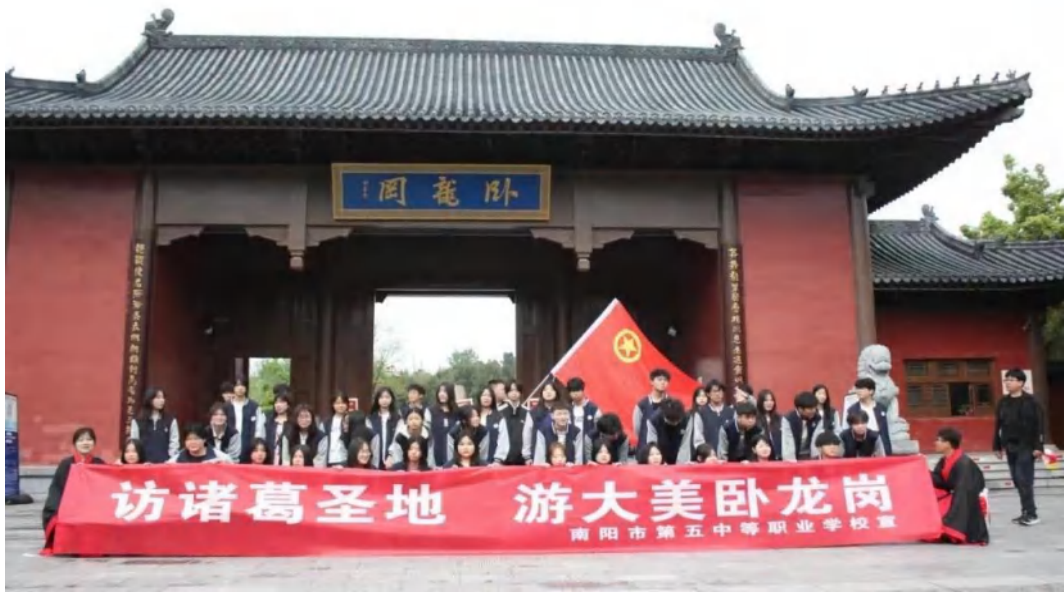
图 2-13 “访诸葛圣地，游大美卧龙岗”研学活动