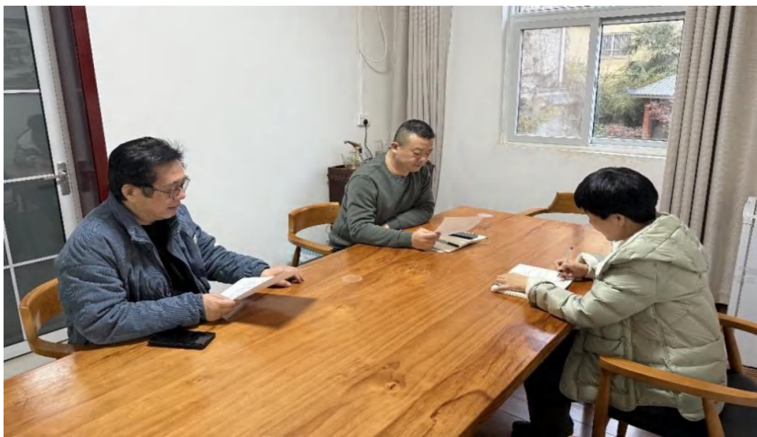
图 1-1 2024.11 校领导班子会议

学校以“政治建校、德育治校”为轴心，坚持和完善党组织全面领导，构建“一轴两驱四融合”党建工作模式，推动党建工作与教育教学等各项工作有效结合、深度融合。