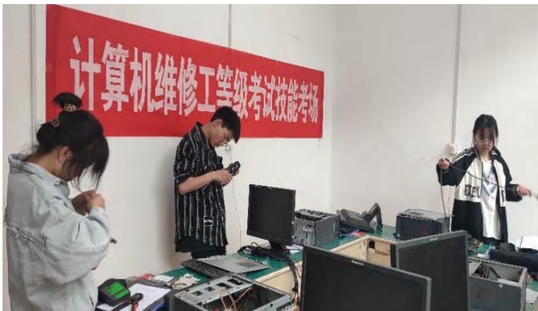
图 7-7 计算机维修工等级考试