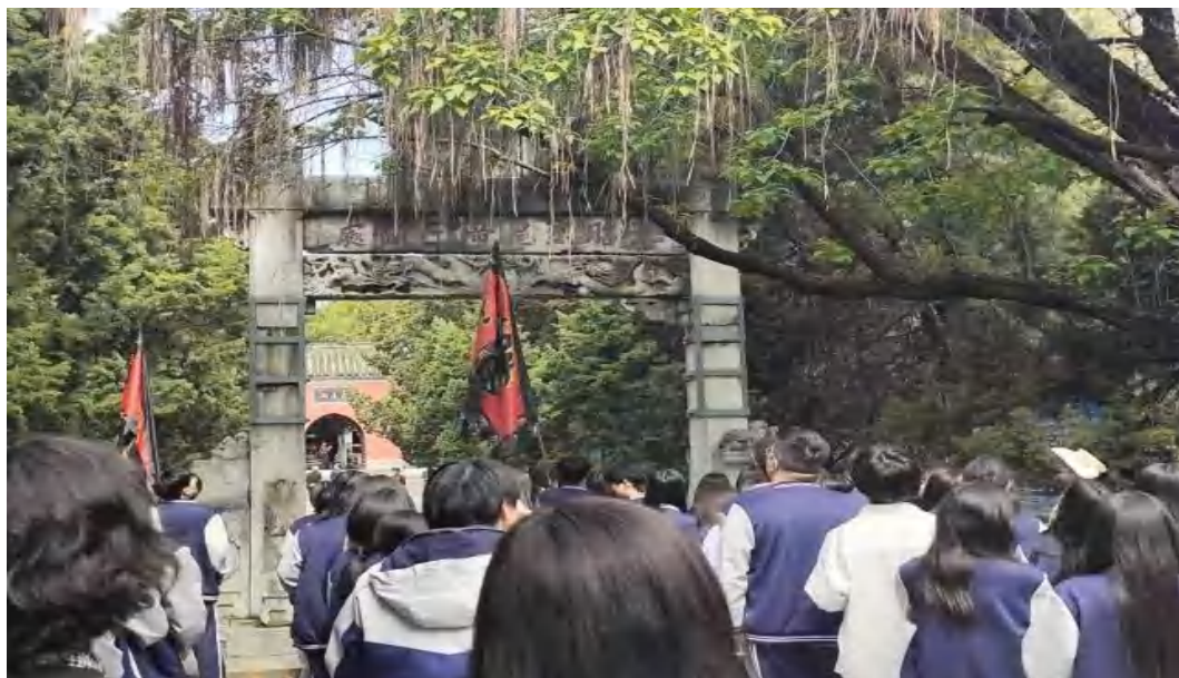
图 2-15 “爱国主题”研学活动

全面提升学生综合素质，我们坚持德育为首，把立德树人作为教育根本任务，以培养德智体美劳全面发展，有理想、有道德、有文化、有纪律，有特长的合格公民为目标，树立让每位学生生命都绽放光彩宗旨，提高学生综合素质，让学生成为成长的力量，从而为他们终生发展奠基。通过集体旅行方式走出校园，亲近自然、热爱自然，走进社会、走访社区，感受不同风土人情、人文历史、社会变迁；通过在游中学，学中研，研中思，思中行，研学并举，知行合一。在此过程中提高学习兴趣，拓展视野、丰富知识，增强公德意识、安全意识、合作意识、规则意识、环保意识；通过社会调查、参观访问、亲身体验、资料搜集、专家点评、集体活动、同伴互助、文字总结等为一体研学活动，培养学生自理能力、沟通能力、写作能力、调查研究能力、创新能力、合作能力和实践能力等。