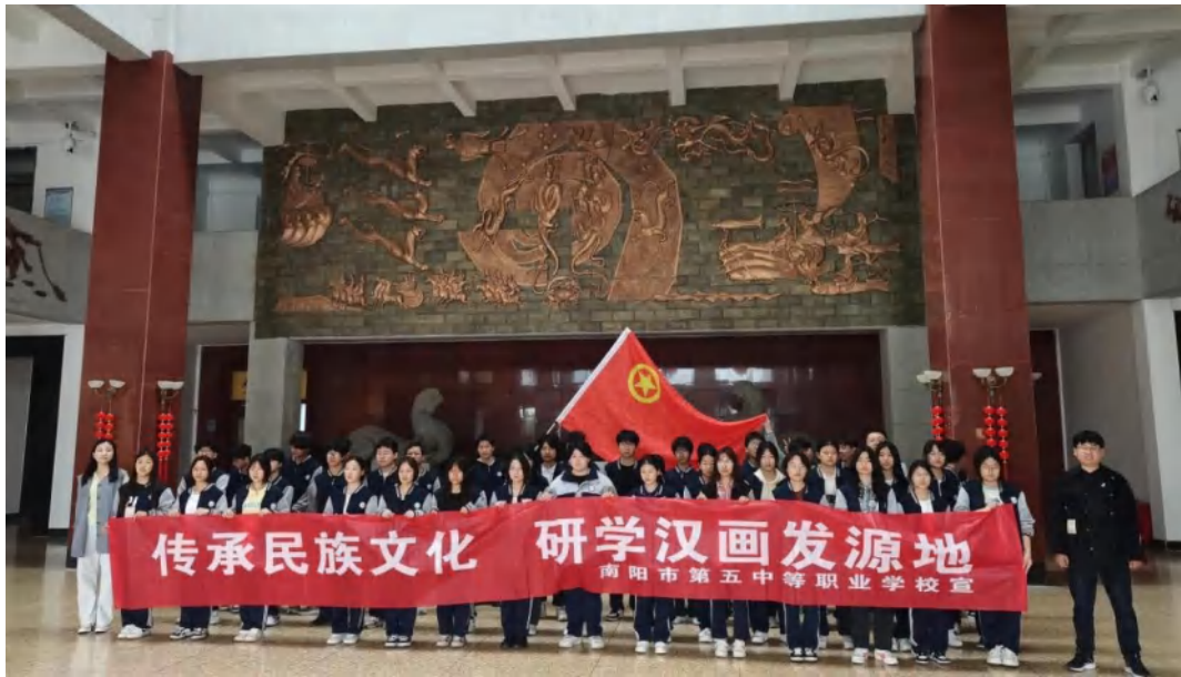
图 6-7 汉画馆研学