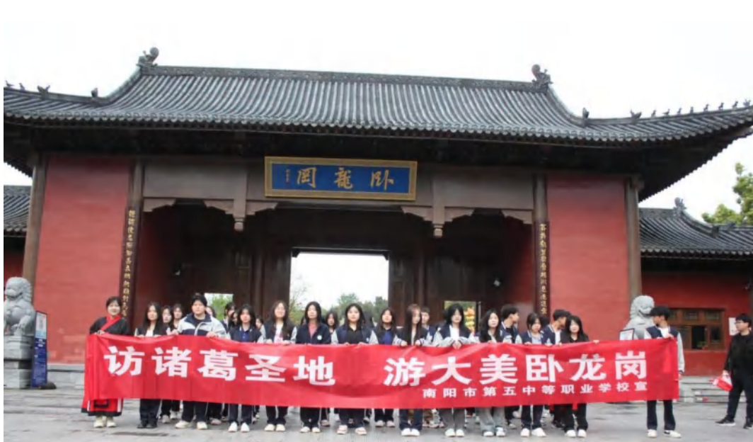
图 6-6 卧龙岗研学