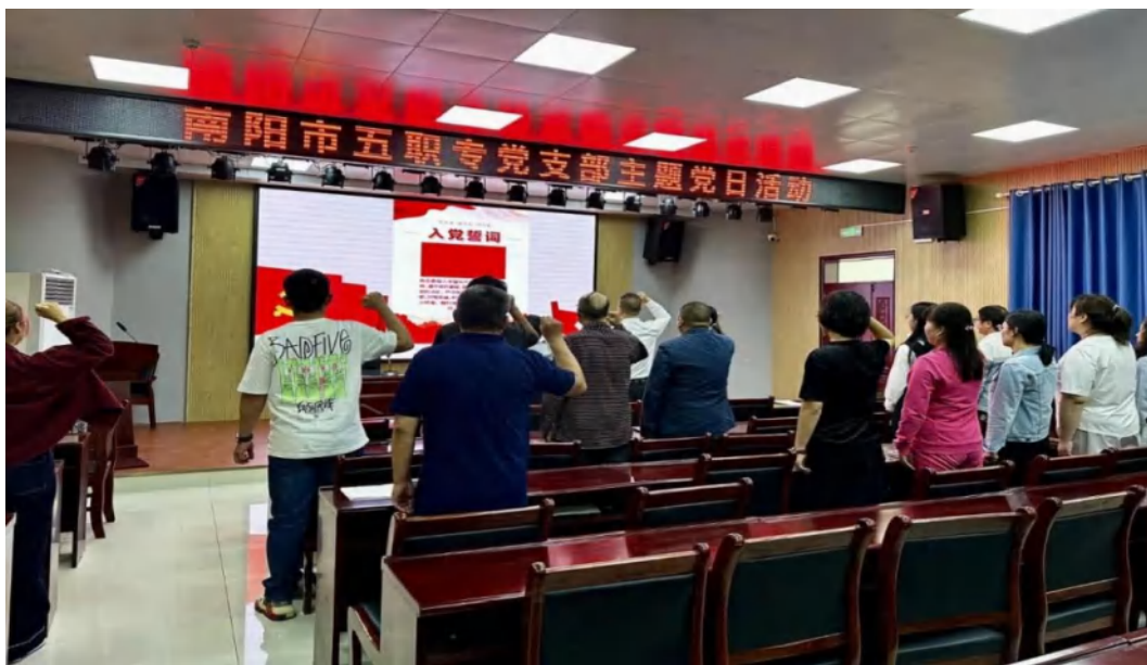
图 1-3 2024.10.9 党支部主题党日活动

学校党支部将学习贯彻习近平新时代中国特色社会主义思想、党的二十大、二十届三中全会精神作为首要政治任务，通过“三会一课”、主题党日等形式，组织全体党员、干部深入学习党的理论知识。共召开支委会 10 余次，专题研讨 50 余次，党员集中学习 60 余次。切实提高党员干部政治理论水平。为增强学习吸引力和实效性，学校采用线上线下相结合方式，利用学习强国、智慧党建等平台，丰富学习资源。同时，邀请专家学者举办专题讲座 10 余场，组织党员干部观看红色警示教育片等 10 余部，多次开展红色教育基地参观学习，引导党员干部传承红色基因，坚定理想信念。