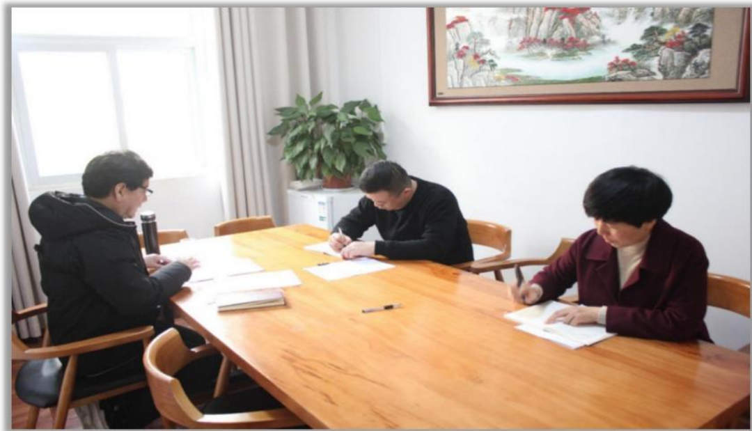
图 1-2 2024.3.7 学校党支部委员会会议

学校以“政治建校、德育治校”为轴心，坚持和完善党组织全面领导，构建“一轴两驱四融合”党建工作模式，推动党建工作与教育教学等各项工作有效结合、深度融合。