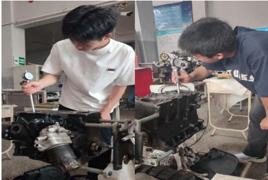
图 7-6 汽车维修工培训