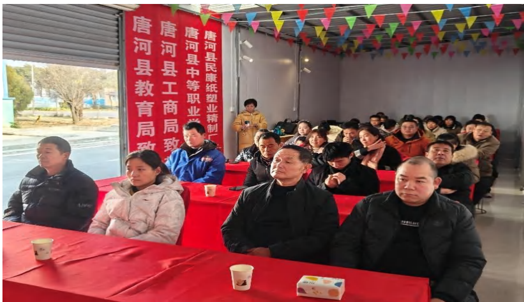
图 7-2 2024 级新型职业农民培训唐河电商班