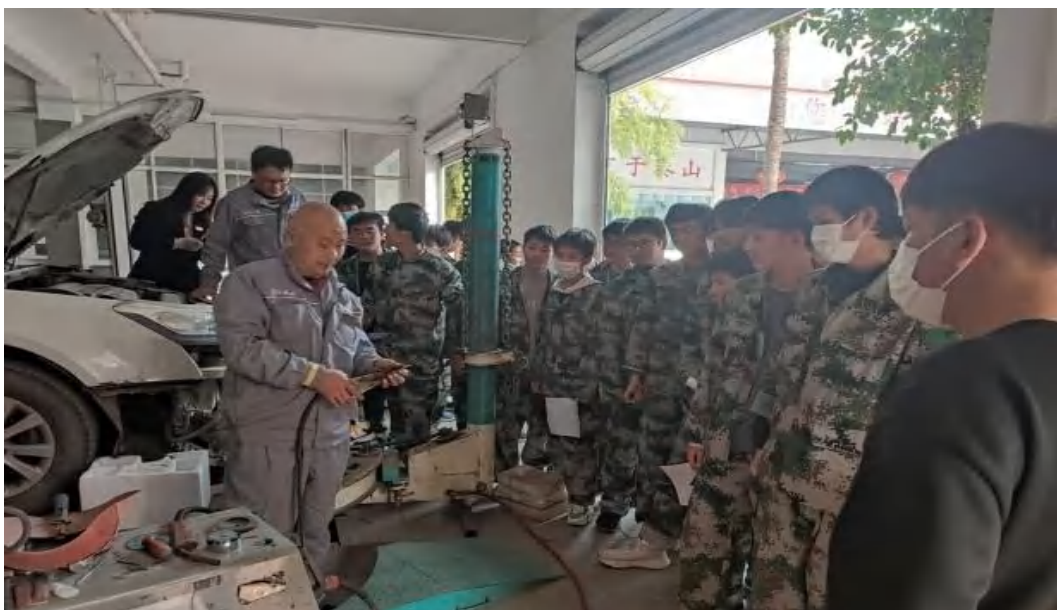
图 4-2 我校学子到龙鹏汽车实训基地实训