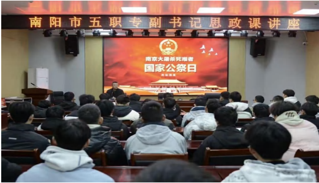
图 1-14 2024.12 国家公祭日思政课讲座