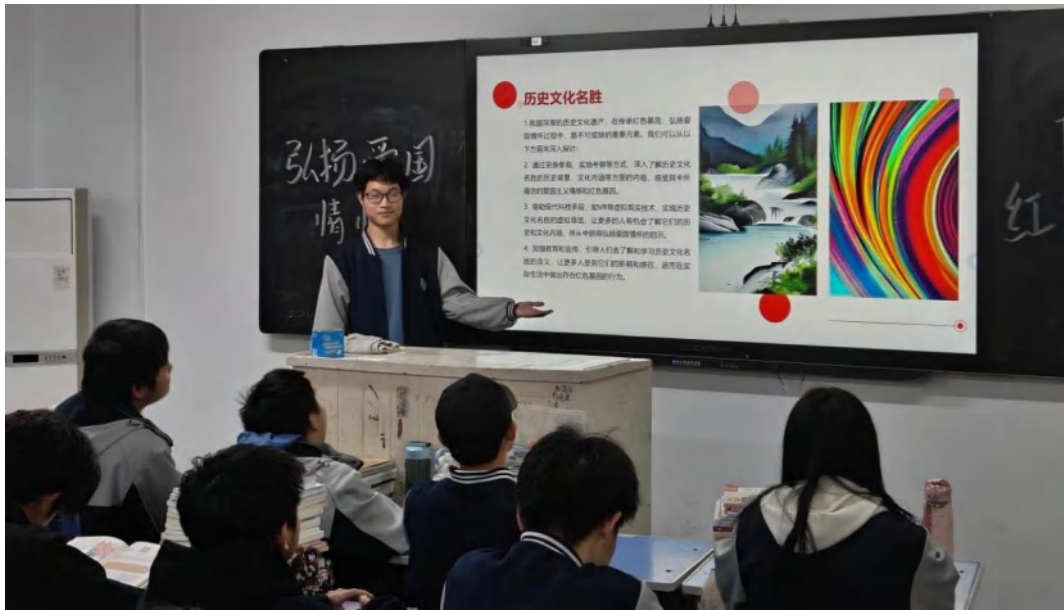
图 6-2 弘扬爱国情怀主题班会课