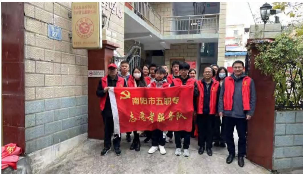
图 2-14 西华社区志愿者服务主题活动

以上丰富多彩的主题实践活动，从各个方面促进了学生个性发展，彰显了学生意气风发精神面貌，弘扬了中华民族优秀传统文化