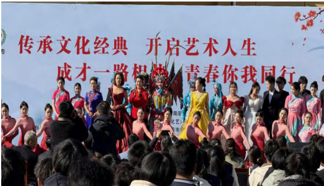
图 1-11 2024.11.29 传统文化进校园