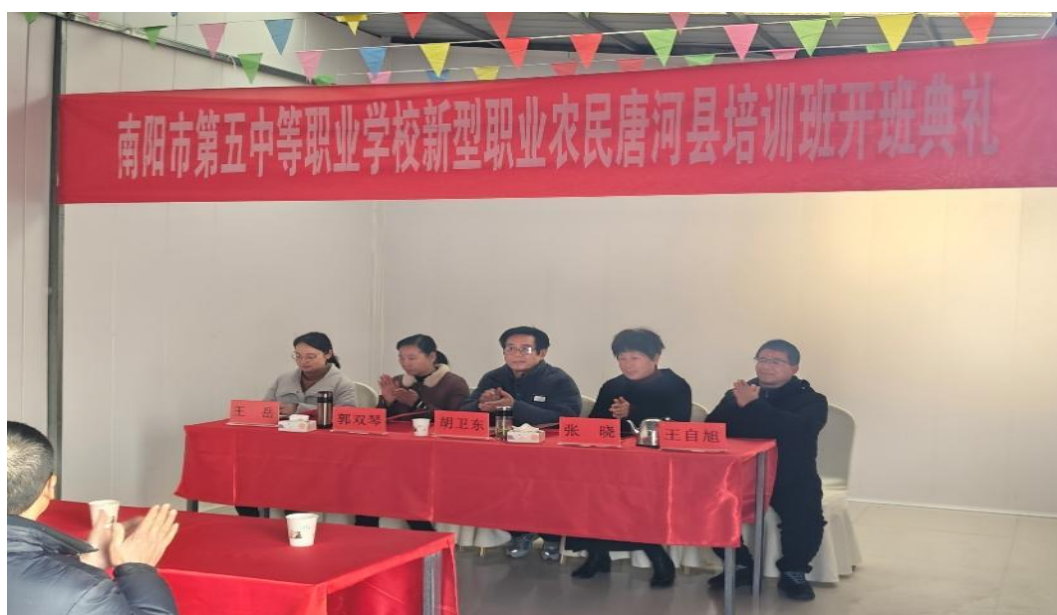
图 7-1 2024 级新型职业农民培训唐河电商班开班仪式

了 257 名新型职业农民学员。这些学员犹如 257 颗充满希望的“火种”，在学校与地方合作精心搭建的成长平台上如饥似渴地汲取知识养分，通过实践锻炼不断磨砺自身专业技能，已然成长为乡村振兴道路上的有生力量，时刻准备奔赴乡村各个角落，运用所学知识去点燃乡村发展的“燎原之火”，助力乡村实现产业兴旺、生态宜居、乡风文明、治理有效、生活富裕美好愿景。