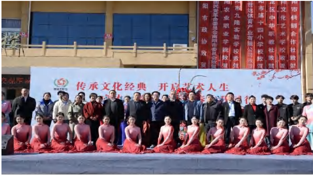
图 6-12 文化艺术进校园活动