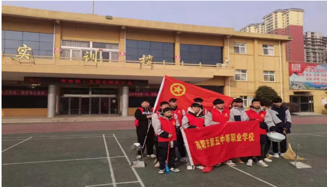
图 2-5 “学雷锋—文明实践我行动”实践活动