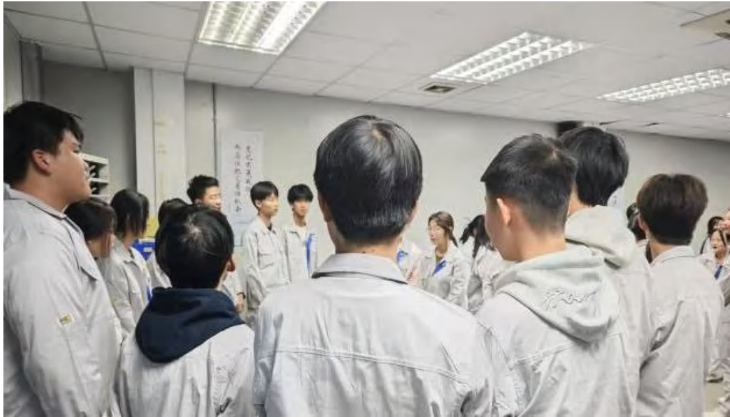
图 4-3 学生上岗就业实习