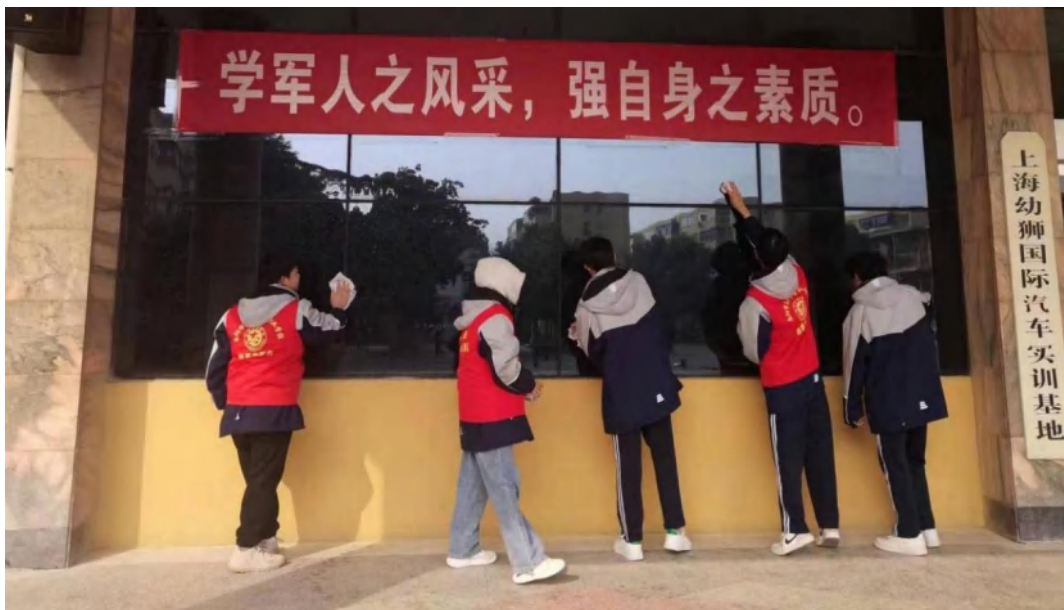
图 6-3 学雷锋实践活动