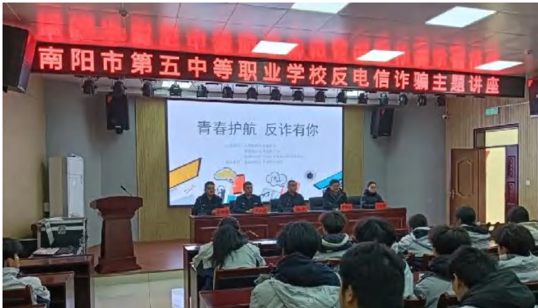
图 6-9 青春护航 反诈有你主题讲座