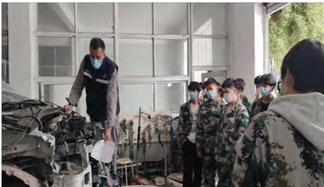
图 4-5 学生上岗前模拟训练