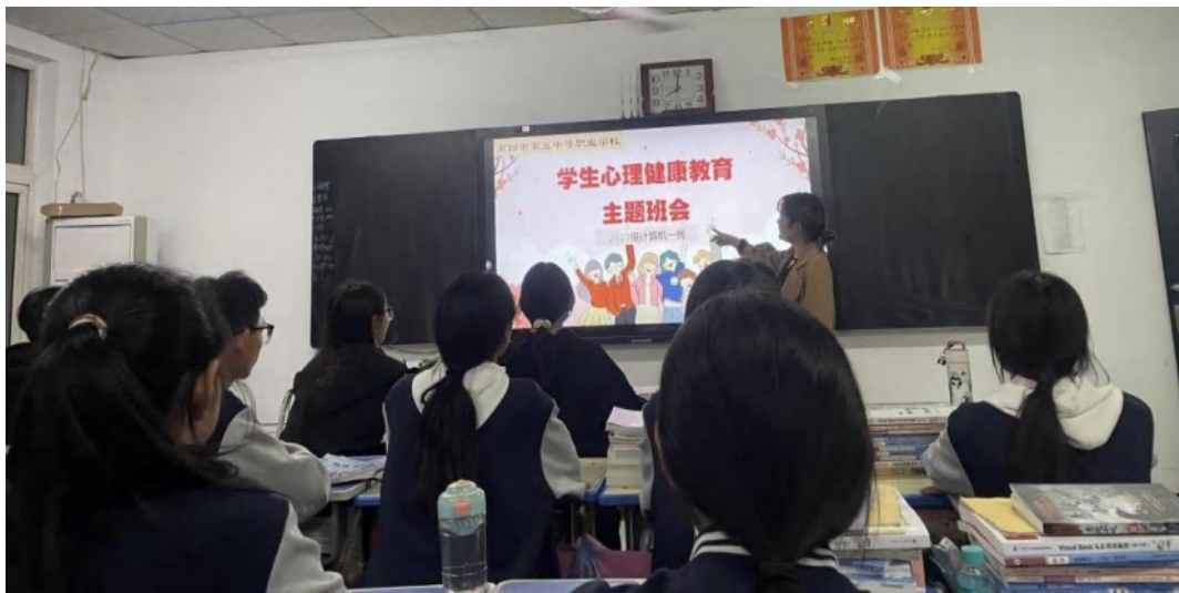
图 2-16 心理健康主题班会

一是开设心理健康课程。开设《心理健康与职业生涯规划》。二是心理健康教育活动。通过主题班会、讲座、团体辅导等形式，开展生命健康教育、挫折教育等，培养学生积极向上心理品质；组织心理健康知识竞赛、心理委员培训等活动，提高学生心理健康意识和参与度。