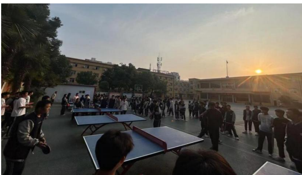
图 1-9 2024.10 乒乓球比赛