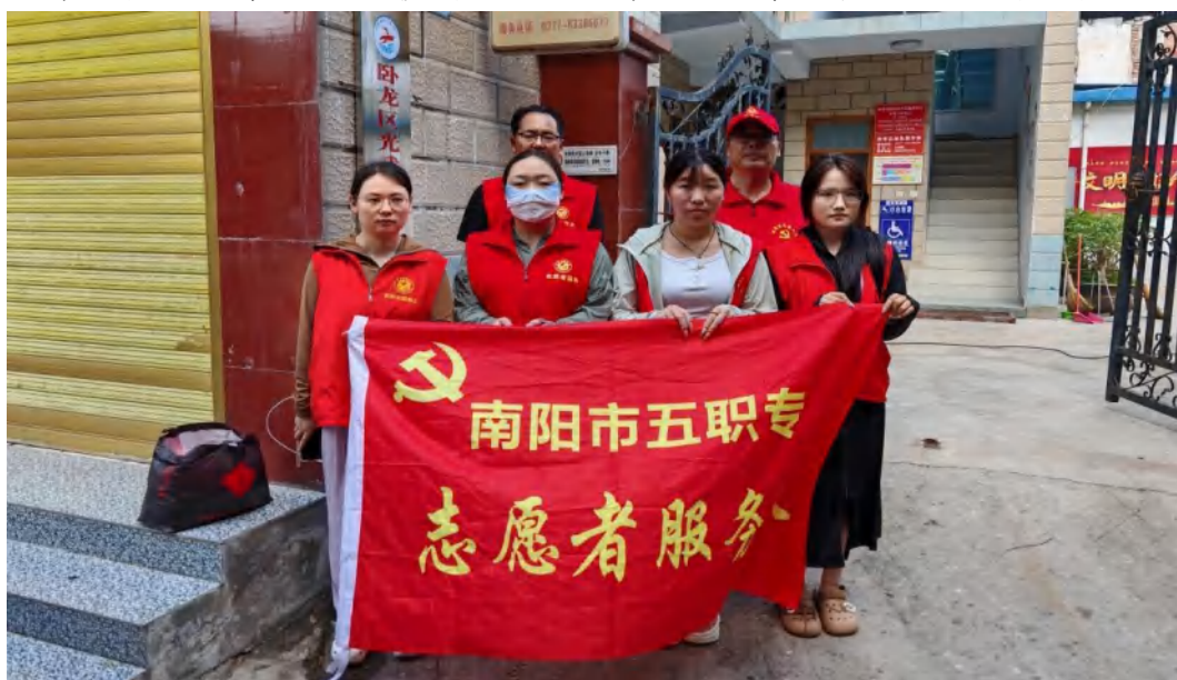
图 1-12 2024.7.26 志愿服务

目前，学校共有党员 38 名，其中在职 19 人，退休 19 人，他们在各自岗位上发挥着先锋模范作用。学校加强党员教育管理，通过“三会一课”、主题党日活动、党员教育培训等形式，定期开展党性教育等活动，提高党员党性修养和综合素质。学校还设立党员示范岗和责任区，明确党员职责、任务，激励党员在教育、教学、管理服务等工作中争创一流业绩。鼓励党员教师在教育、教学中发挥先锋模范作用，参与课程改革、教学研究和指导学生技能竞赛等工作，开展教学技能竞赛活动，并取得了较好成绩。