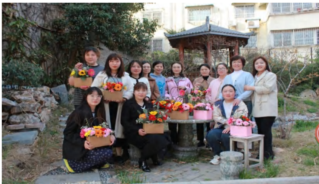
图 1-13 2024.3.8 三八妇女节活动

帮扶等工作，维护职工合法权益。本年度，工会组织了教职员工运动会、三八节、重阳节等活动，丰富了教职工业余生活。加强团的建设，发挥共青团在学生思想教育和成长成才中的重要作用。组织青年团员开展主题团日活动、志愿服务活动等，培养学生社会责任感和奉献精神。指导学生会开展工作，支持学生会参与学校管理和学生自我服务，提高学生自主管理能力。