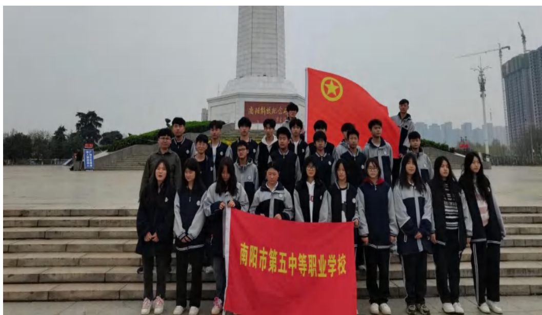
图 6-1 清明节祭英烈

为弘扬和传承红色基因，激发学生爱国爱岗热情，2024年我校积极组织了一系列“传承红色基因”系列教育活动。在3月份开展学雷锋主题宣传活动，将雷锋精神融入学生日常生活中，通过开展学习雷锋精神主题班会、组织学生参加主题思政课等活动；在清明节，我校组织开展了“清明祭英烈”主题系列活动，以多种形式祭扫活动重温历史、缅怀先烈、致敬英雄，用行动传承浓烈炽热红色基因、发扬革命传统、弘扬民族精神；9月29日，校团委成功举办“诗韵中华·共庆华诞”红色诗歌朗诵比赛，活动不仅激发了学生的爱国情怀，激扬了奋进力量、赓续了红色血脉，也弘扬了传统节日文化，丰富了校园文化生活，展现了学生昂扬向上的精神风貌。