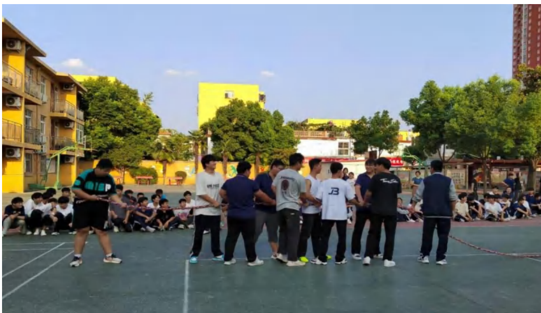
图 1-8 2024.9 拔河比赛