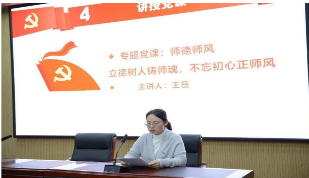
图 1-7 2024.11.6 师德师风专题

学校坚持以学生为中心，关注学生思想动态和成长需求，通过多种途径加强学生思想教育。一是加强思想政治课程建设，优化课程内容和教学方法，提高思想政治课吸引力和实效性。思想政治课教师积极探索案例教学、情境教学、小组讨论等教学方法，引导学生主动思考、积极参与，培养学生思维能力和分析、解决问题能力。二是丰富学生课余文化生活，开展形式多样校园活动，学生根据自己兴趣爱好自主选择参加。通过校园活动，培养学生团队合作精神、创新能力和综合素质。三是组织学生参加社会实践活动，如社区志愿服务、红色基地研学、企业实习等，让学生在实践中了解社会、增长见识，增强社会责任感和使命感。四是注重加强心理健康教育，设立心理咨询中心，配备专职心理咨询师，为师生提供心理咨询服务，帮助师生解决心理问题，增强心