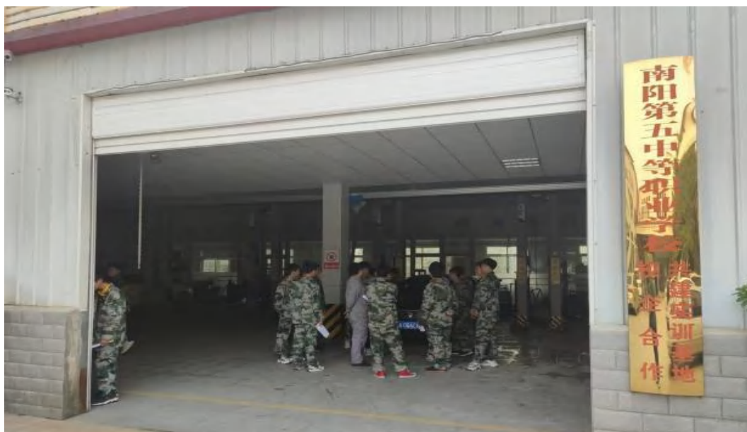
图 4-1 我校学子到龙鹏汽车实训基地实训