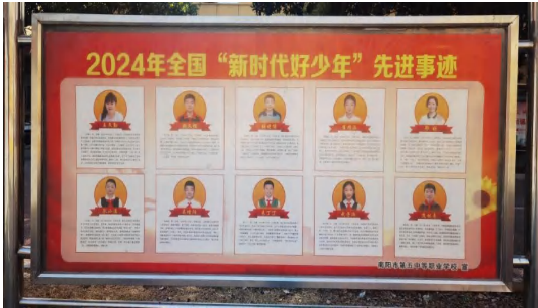
图 6-8 校园文明风采 榜样学习展板