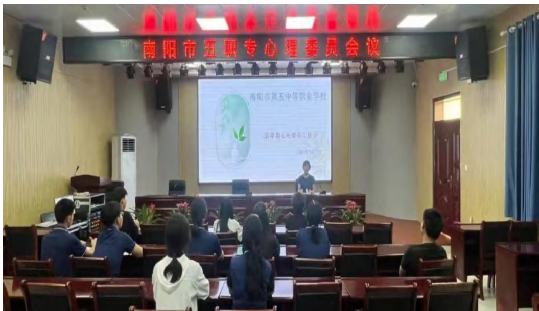
图 2-9 心理委员会议