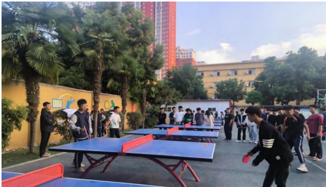
图 6-11 乒乓球比赛