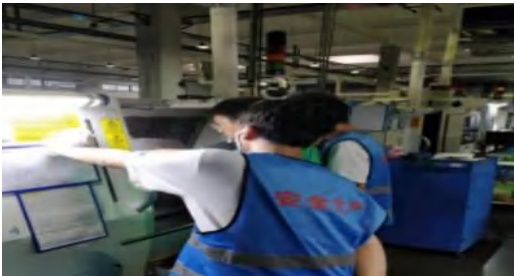
图 4-4 学生上岗前模拟训练