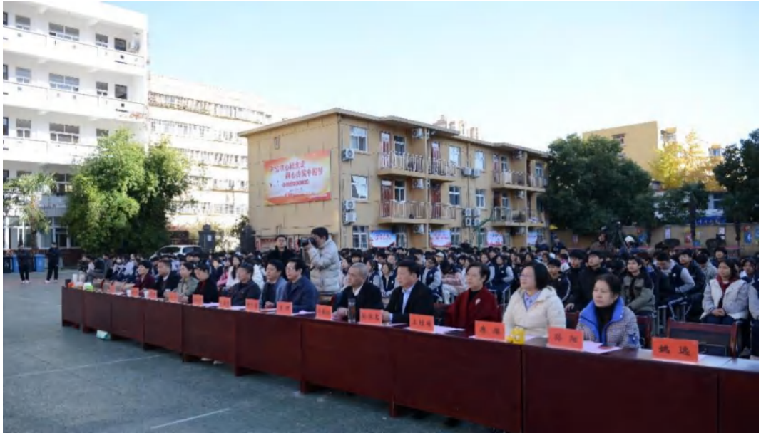
图 7-4 “文艺进校园”活动 师生观看表演