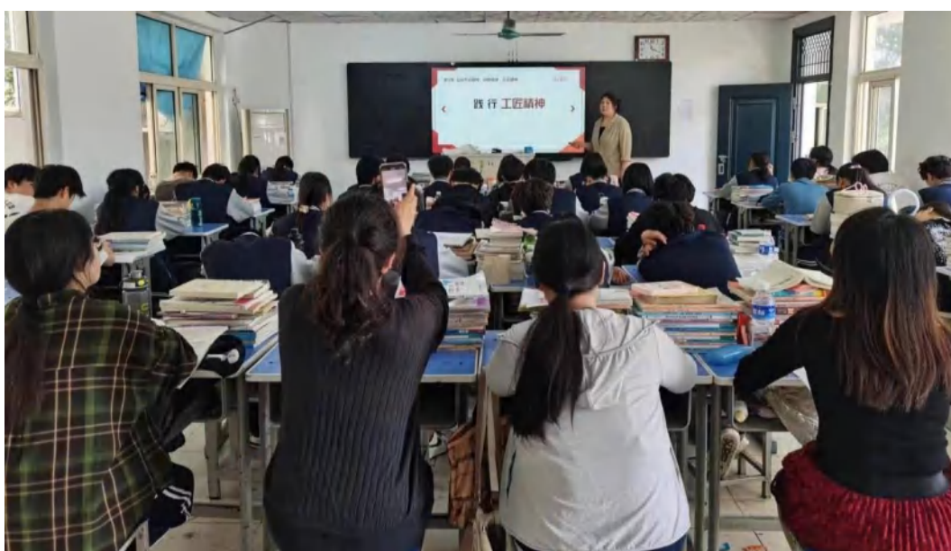
图 2-4 思政课大比武