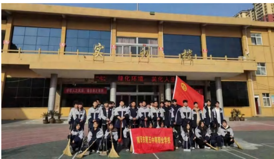
图 2-10 植树节开展“绿化环境，美化人生”文明实践活动