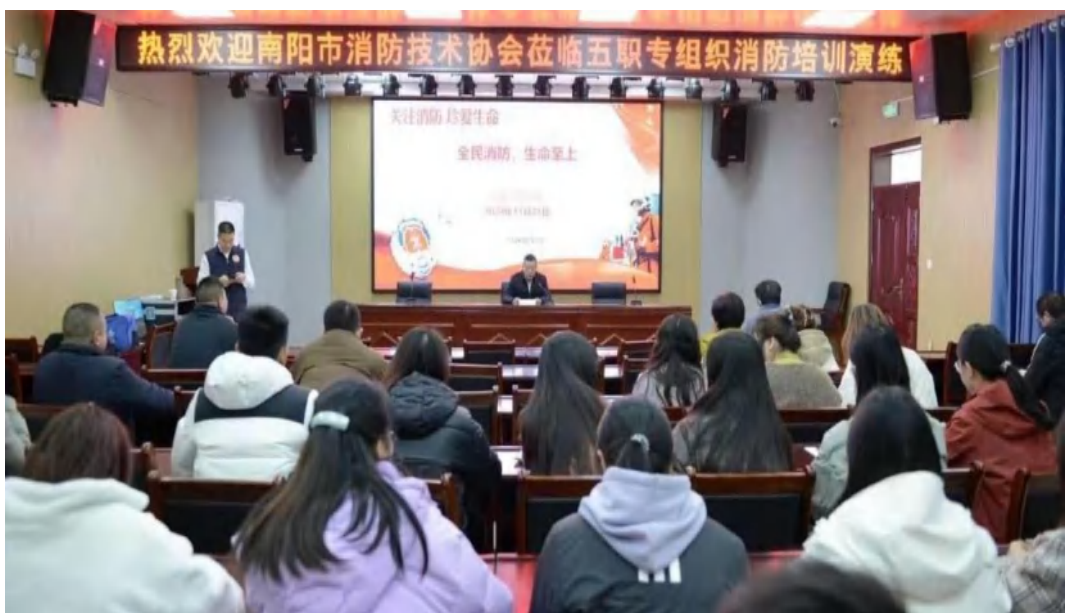
图 2-8 消防培训讲座