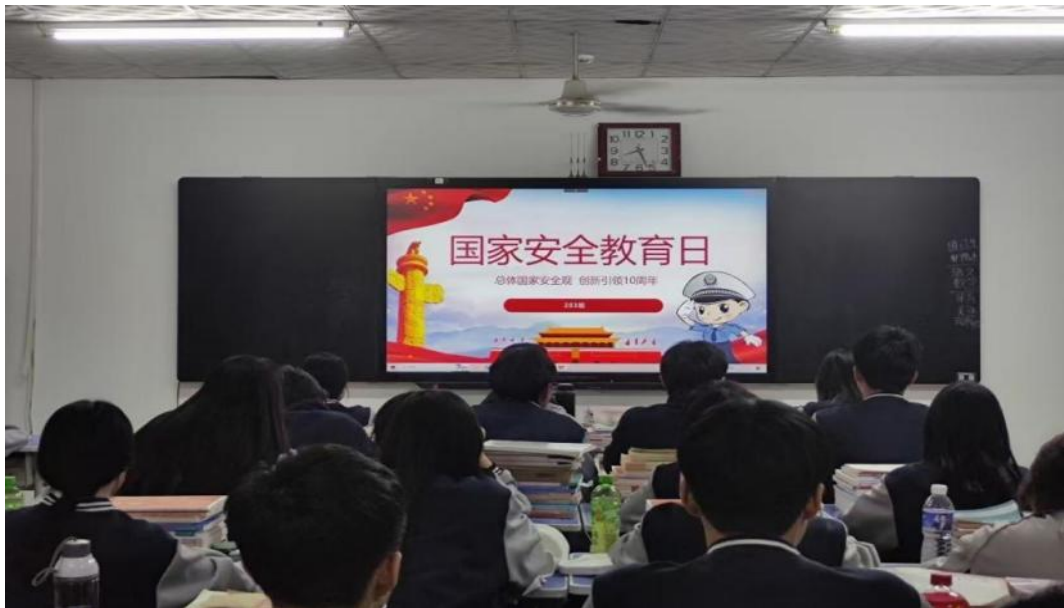
图 2-6 “国家安全，青春挺膺”为主题的团日活动