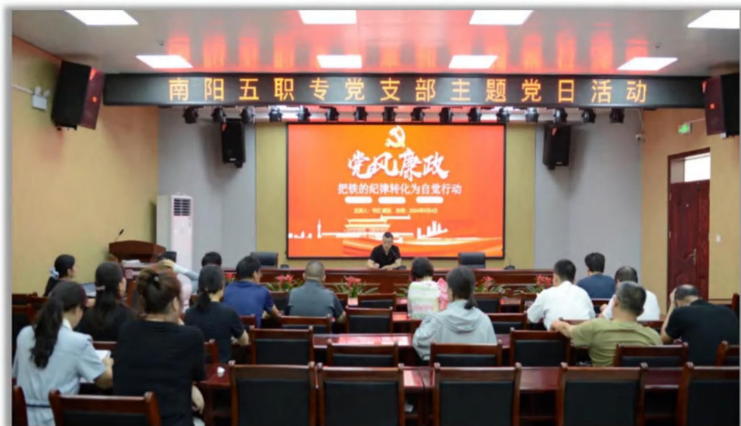
图 1-5 2024.1.16 党风廉政专题会议

学校党支部充分发挥政治核心作用，加强对学校各项工作的政治领导。完善支部领导下的校长负责制，明确支部、行政职责分工，建立健全民主决策机制。在重大事项决策当中，严格遵循“集体领导、民主集中、个别酝酿、会议决定”原则。如在学校发展规划制定、重大项目建设、人事任免等方面，均集会进行充分讨论，广泛征求意见，确保决策科学性和民主性。同时，加强对学校行政工作监督、指导，确保学校各项工作，沿着正确政治方向前进。