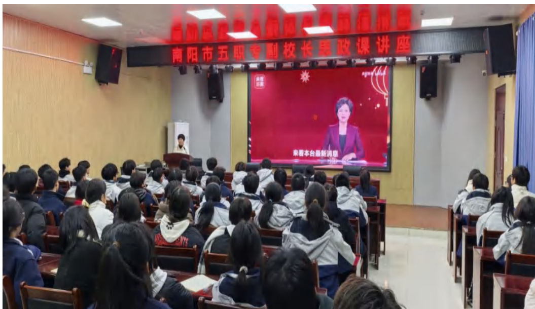
图 2-3 沙小会副校长讲思政课