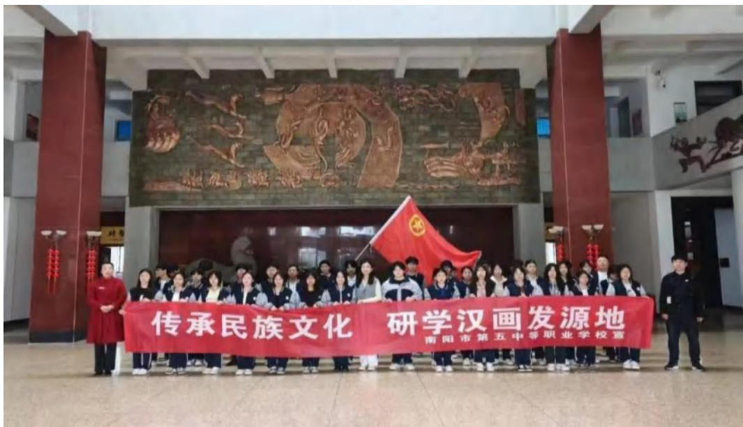
图 2-12 “传承民族文化，研学汉画发源地”研学活动