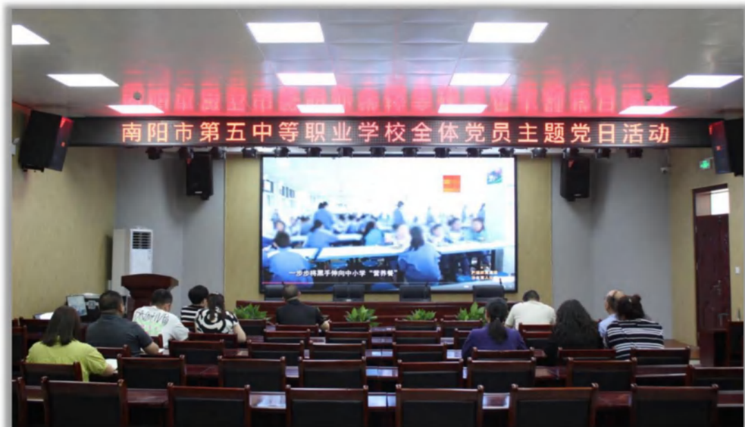
图 1-4 2024.5.21 观看反腐警示教育片