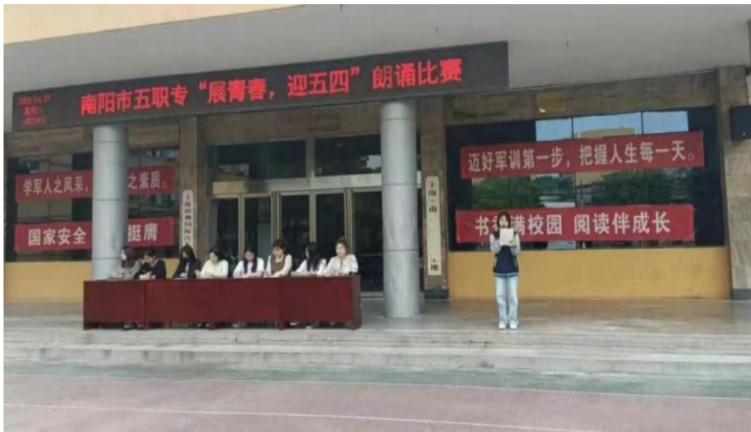
图 2-11 五四青年节诗朗诵活动